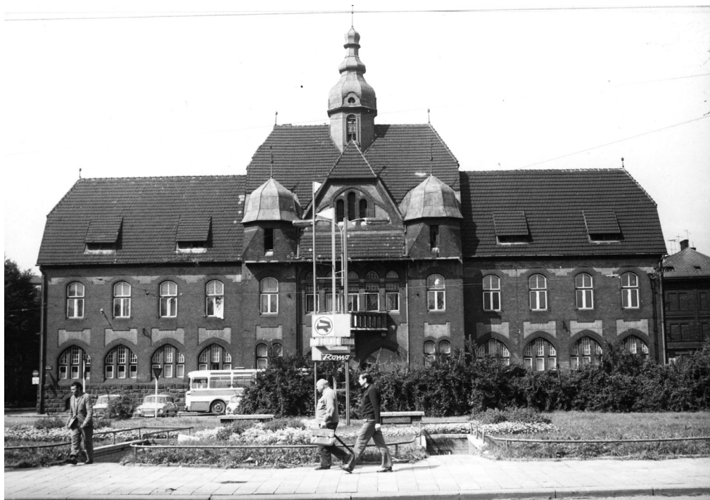
Obr. 7: Budova vítkovické radnice v době, kdy v ní sídlil archiv.