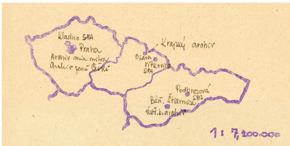
Obr. 1: Plánovaná síť sdružených podnikových archivů v roce 1954. Archiv Vítkovice, a.s., fond Vítkovice s.p., 1954–1963 I., kart. 93, inv. č. 700.

I v dalších letech však vítkovický archiv patřil k předním institucím na poli podnikového archivnictví. Jeho vůdčí postavení je patrné v „rebélii“ při odmítnutí generální inventarizace dokumentů z roku 1968 (Viz dále), která se následně odrazila v dalších osudech jeho zaměstnanců.