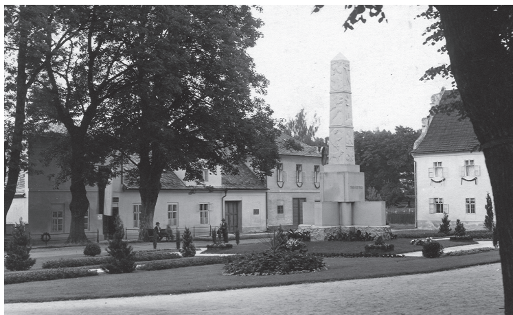
Obr. 5: Zámecké náměstí v Jeseníku s bývalými biskupskými správními a hospodářskými budovami v pozadí, 1937.

„Od nepaměti je povinno toto městečko, včetně všech jeho obyvatel, ať už jsou to měšťané, hospodáři, osamělé ženy, komorní služebníci nebo služebné, bohatí nebo chudí, a všichni ostatní, kteří se zde na tomto místě zdržují, 4 dny ročně robotovat na knížecím poplužním dvoře, jako kosit, žnout trávu, vázat, pohrabat oves atd., nebo platit robotu penězi podle starého zvyku za každý den 9 krejcarů, ale tak, aby za tyto peníze jiných robotníků mohlo se v době žni objednat.“ 95 Robotna na jesenickém panství se dělila na potažní a pěší a její forma byla určena. Obyvatelé tzv. Svobody kromě práce na velkostatku museli každoročně sázet, sklízet a obracet len a také ho vázat. Měšťané žijící na náměstí měli navíc povinnost bezúplatně svážet do biskupského dvora seno z tzv. schleyff Gärten 96 a rovněž museli odevzdat 1 měřici z každého šeflu sladu, který se nechali namlít ve vrchnostenském mlýně. 97 Reluované roboty platilo pět vsí (Domašov, Lipová, Písečná, Zejf a Široký Brod), z nichž dohromady odcházelo ročně 296 zlatých a 10 krejcarů. Naproti tomu vsi Adolfovice, Bukovice a Česká Ves musely vykonávat robotní povinnosti „in natura“ u biskupského poplužního dvora. 98 Příjmy z propuštění z poddanství nejsou v urbáři vykazovány, protože je biskupští poddaní, kteří se chtěli přestěhovat na jiná panství, museli zaplatit přímo u vrchnostenské vlády v Nise.