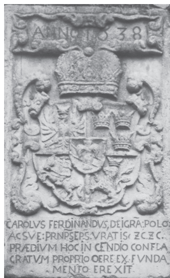
Obr. 2: Kamenná deska vratislavského biskupa Karla Ferdinanda Vasy z roku 1638 připomínající znovu vybudovaný biskupský statek po velkém požáru města. Freiwaldau-Gräfenberg: die Kurstadt im Altvatergebirge und die Dörfer im oberen Bielethal: ein Heimatbuch, Kirchheim u. Teck 1987, reprofoto.