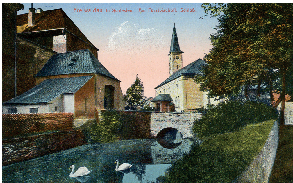
Obr. 4: Vodní tvrz v Jeseníku, bývalé biskupské správní centrum panství, s vodním příkopem a přístavbami, které již dnes nestojí, 1924. Sbírka obrazového a fotografického materiálu SOKA Jeseník, neinv., sign. 01/041.

dob Její nejjasnější a blahoslavené vlády opět praktikuje a podléhajících třináct krčem toto [pivo – pozn. aut.] vydává.“ Přímus šenkovat vrchnostenské pivo měla v době sepsání urbáře vesnická krčma v Domašově, Adolfovicích, v Bukovicích dvě krčmy (šoltéžská a tzv. hutní), v Lipové, České Vsi, Písečné, Zejfu, Širokém Brodě, v Mikulovicích opět dvě krčmy (ve vsi a tzv. hamerní), Nové Vsi (něm. Neudörfel, na místě rozparcelováno mikulovického tzv. Studeného dvora) a v Supíkovicích. 64 V hospodářském roce 1687/1688 se spotřebovalo 1500 šeffů pšenice, z prodeje uvařeného piva se získalo 6376 zlatých a 24 krejcarů. 65 Kromě vrchnostenského piva vařeného v biskupském pivovaru v Jeseníku se na panství šenkovalo pivo dovezené z Nisy, „ jak se zde dříve praktikovalo a bylo obvyklé “. Z prodeje nízkého piva byl příjem dalších 1646 zlatých a 24 krejcarů (za léta 1682/1683). 66 Ve městě bylo 36 právovárečných měšťanských domů na náměstí (něm. Ring), na Svobodě (něm. Freiheit) stála krčma, kde se pivo právovárečných měšťanů z náměstí prodávalo. Právo várečné a palené neměli obyvatelé předměstí a samotné Svobody, kteří ovšem museli pivo, které bylo uvařeno a nadbývalo, sami vypít. 67 Pálenka se vozila v sudech z Nisy, u písaře biskupského úřadu pak byla vyměřena a distribuována do krčem. 68 Za účetní období 1687/1688 byl prodáno 64 věder a 2 hrnce pálenky, celkově za 448 zlatých a 42 krejcarů. 69