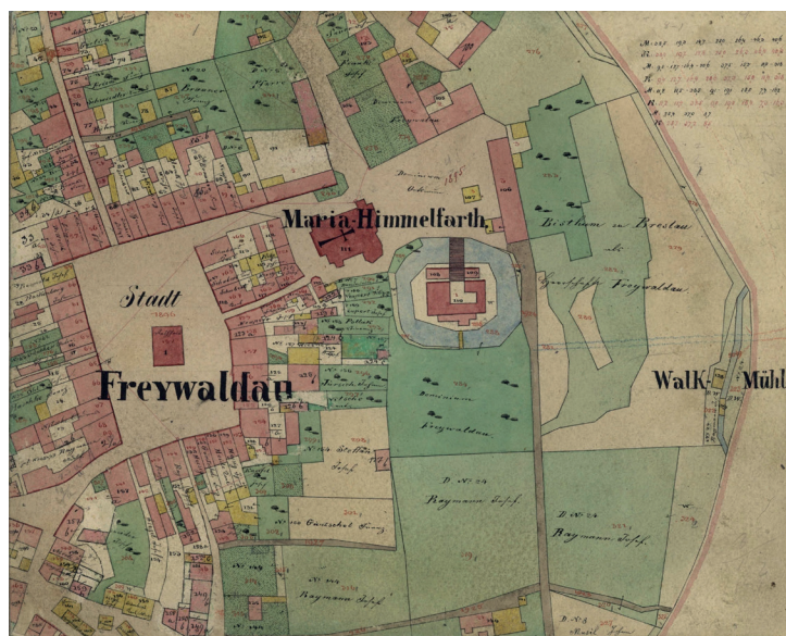
Obr. 1: Indikační skica stabilního katastru s výřezem centra Jeseníku, Vodní tvrzí, pozemky a budovami patřícími biskupství, 1836. ZA v Opavě, Stabilní katastr slezský, kart. 18, inv. č. 69.

Cílem předložené práce je představit urbář jako zásadní pramen pro poznání správních a hospodářských dějin jesenického panství v 17. století, samotného města a okolí. Nedílnou součástí jsou přehledy jeho stavu a důležitých výnosů, vlastního patrimoniálního podnikání a příjmů z něho, spolu s překlady zajímavých výňatků a cenných pasáží. Tedy prezentovat urbář nejenom jako souhrn předpisů, nároků, peněžních a naturálních povinností poddaných, ale také jako zdroj autentických zpráv o stavu města Jeseníku, podniků a zařízení, které tvořily základ hospodářství tohoto nevelkého podhorského panství.