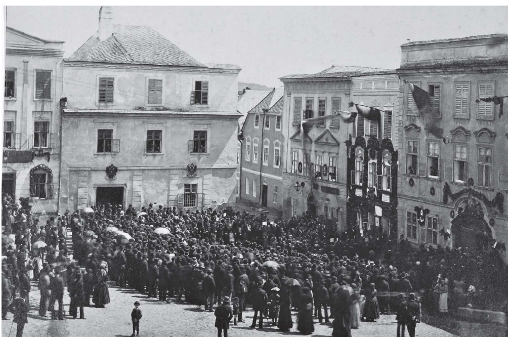
Obr. 2: Dvorce, odhalení pamětní desky Wilhelmu Jahnovi