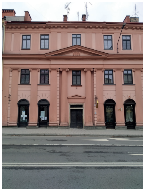
Obr. 2: Dům čp. 16 v Těšíně, 1835.

vyložená korunní římsa. Nad tím je umístěno další později dostavěné patro. Jediným horizontálním prvkem je pásová rustika po stranách průčelí. Na hlavní osu prolamuje hladkou fasádu kamenný portál s obdélným nadsvětlíkem a trojúhelníkovým štítem. V patře je situováno obdélné okno. Styl řešení fasády má více zdrojů a vymyká se z místní dobové produkce. Kanelované dřívky, pilastry a vtažený portikus přes celou výšku budovy má stylová východiska, která mohou odkazovat na pruský klasicismus inspirovaný řeckou architekturou. Vstupní rizalit evokuje vstup do řeckého chrámu. Vtažené okenní osy se objevují i u jiných staveb na počátku 19. století, vytvářejí však odlišný dojem s iónskými hlavicemi a objevují se v horních patrech nad portiky, např. u zámku Nové zámky u Litovle z let 1806–1808 nebo u zámku v Hnojníku asi z roku 1836. Vtaženou okenní osu najdeme také u věže farního kostela Máří Magdalény v Těšíně. Stavitel použil palácový styl na měšťanském domě. Tento proud architektury se projevil i ve vídeňské architektuře 30. let 19. století.