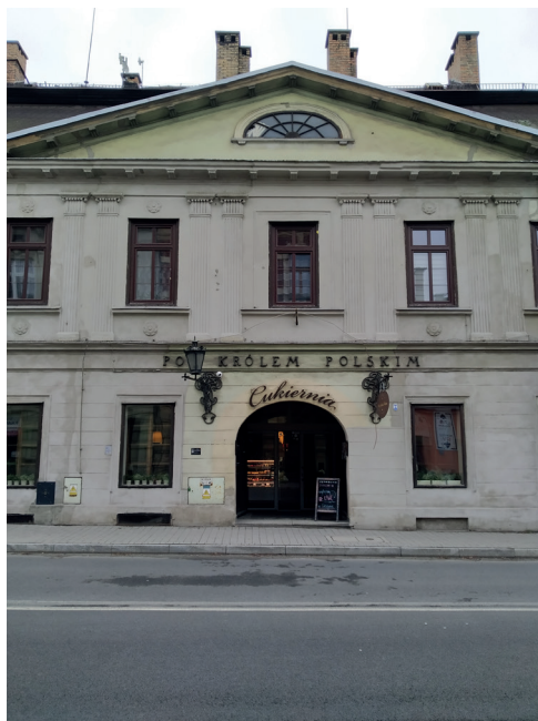
Obr. 1: Dům čp. 10, 1815.