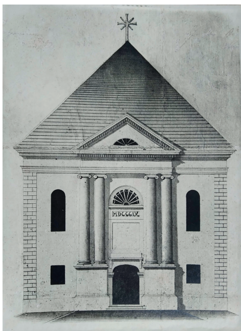
Obr. 5: Evangelický kostel a. v. v Bystřici, foto plánu průčelí kostela. Evangelický sbor Slezské církve a. v. v Bystřici.

nad kterými probíhá profilovaná vyložená římsa se zubořezem. Zajímavé architektonické řešení má vstup z presbyteria do sakristie a depotu. Vstup lemují dva vtažené toskánské sloupy po stranách podepírající kladí, které nese valený oblouk. Před tímto prvkem předstupuje segmentový oblouk. Je to atypické a originální řešení vstupu. Vstupní průčelí zdůraznil na hlavní ose rizalit s dvojicí sloupů s iónskou hlavicí na kamenných postamentech. Po stranách je dvojice oken. Nad rizalitem se tyčil trojúhelníkový štít. Nad vstupem se segmentovým záklenkem je termální okno. Fasáda kostela byla ukončena vyloženou římsou se zubořezem. Původní kostel byl postaven bez věže a byl ukončen valbovou střechou. Původní menší dřevěná věžička se zvony stála samostatně mezi kostelem a školou. V roce 1849 byla přistavěna ke kostelu nová věž podle plánů těšínského krajského stavitele Gottfrieda Dittricha. 84 V roce 1822 byly v interiéru kostela umístěny nové pavlače. V roce 1831 kostel získal nový dřevěný oltář a kazatelnu od řezbáře Ondřeje Petera z Frýdku. Oltář byl zasvěcen apoštolům Petru a Pavlu. 85 Další stavební plány kostela pocházejí z přestavby z 30. let 20. století, které však zachycují původní podobu kostela a pavlače. Plány přestavby kostela z roku 1931 vypracoval těšínský architekt Carl Reinhart. 86 Kostel dostal nové třípatrové oratoře. Podle plánu byly rozšířeny boční vstupy, které získaly portikus s toskánskými sloupy nesoucí trojúhelníkový štít se sedlovou střechou.