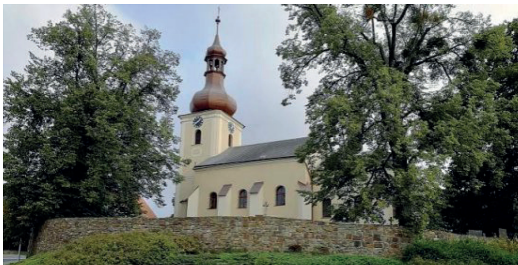
Obr. 2: Farní kostel sv. Václava ve Velké Polomi v současnosti.