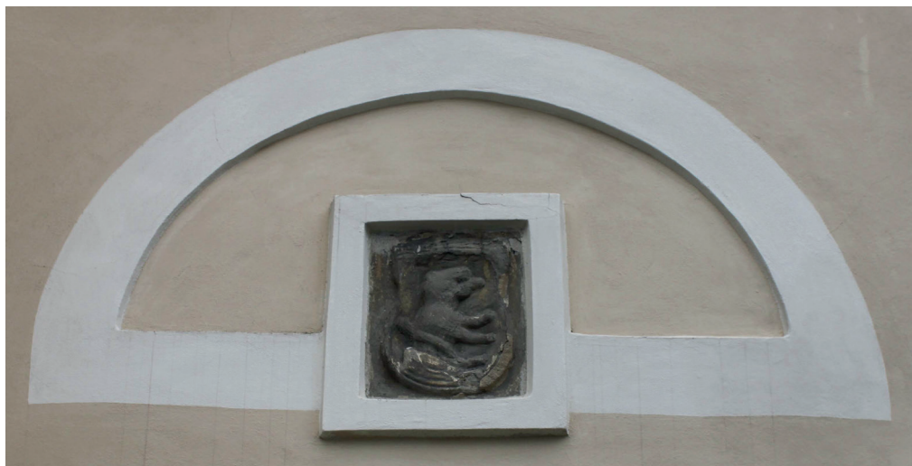
Obr. 1: Erbovní deska na jižní fasádě lodi farního kostela sv. Václava se znakem Donátů z Velké Polomi (figura stojícího kozla) z doby před rokem 1486.

vystřídali Bruntálští z Vrba (Polom vlastnili do roku 1685) a poté cisterciáci z Velehradu, kteří v roce 1702 prodali polomské dominium Vlčkům z Dobré Zemice. 6