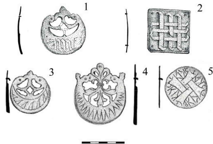
Obr. 3: Vybrané součásti rytířských opasků z archeologické podsbírký Slezského zemského muzea v Opavě. 1–přír. č. 01/023/2018, Velké Heraltice; 2– inv. č. 01/022/2020-172, Kaltenštejn; 3– inv. č. M 657, Cvilín; 4– inv. č. M 550, Vartnov; 5– inv. č. M 652, Cvilín. Obr. 3:1 a 2 kreslila S. Králová, Obr. 3:3 až 5 převzato z P. KOUŘIL – D. PRIX – M. WIHODA, Hradý, Obr. 25:6, Obr. 265:2, Obr. 25:2.

Součástí opasků byly krom nákončí také různé kovové plíšky podobného typu, jako prezentuje příklad z hradu Kaltenštejn. I tato čtvercová kování byla oblíbená v širším geografickém