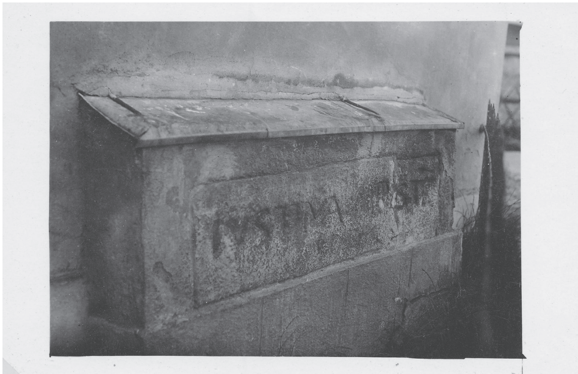
Fotografie kamene s nápisem „IVSTINA MRSTE 1007“, pol. 20. století.

Významnější obyvatelé zmíněných obcí však byli pochovááni také na opavských hřbitovech u kostela sv. Barbory, u farního kostela Nanebevzetí Panny Marie a od roku 1781 také na bývalém hřbitově v místech stavby dnešního kostela svaté Hedviky. Obec Kylešovice sice žádala o zřízení vlastního hřbitova již v roce 1787, jeho otevření se však nakonec dočkala až roku 1869. 4 Ještě déle si na důstojné místo posledního odpočinku počkali občané Otice. Zdejší pohřebiště bylo založeno teprve v roce 1914, do této doby byl využíván nově založený městský hřbitov na Otické ulici v Opavě. 5