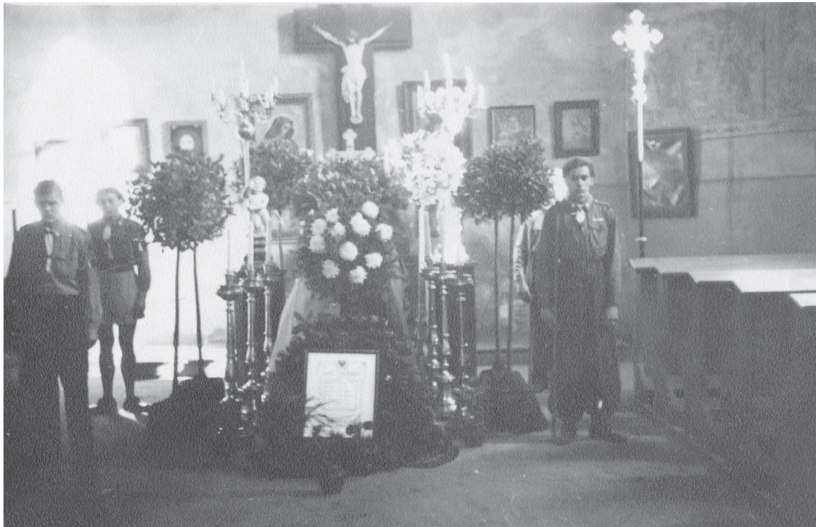
Interiér kaple svatého Kříže při tryzně, listopad 1945.