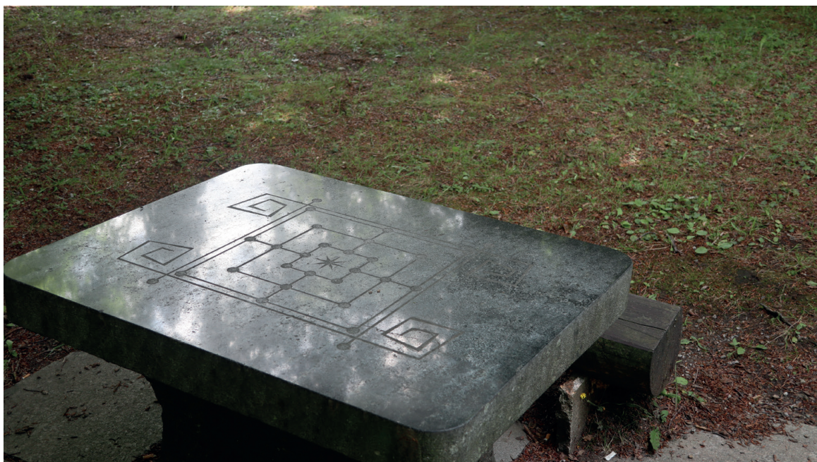
Karlova Studánka, hrací stůlek, žula, 60. léta 20. století.

prosklený měl v interiéru umístěnu kašnu pro jímání minerální vody. Po uzavření zdroje slouží jako prodejna upomínkových předmětů, ale dekorativní kašna zůstala v interiéru zachována.