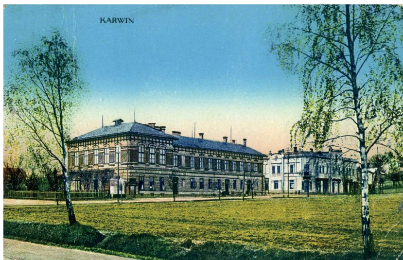
Obr. 1: Panský hotel v Karviné, 1916, kolorovaná pohlednice. Fotodokumentační pracoviště SZM, inv. č. FP 8233/2.

Ve Slezsku počátkem 20. století, s vymezením do roku 1918, se jednalo rovněž o některé z ředitelů, kteří působili v krnovském městském divadle. Z tohoto důvodu se budu nejprve věnovat těmto ředitelům a jejich putování po Slezsku.