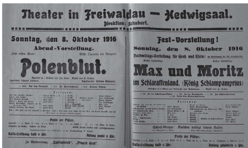
Obr. 2: Divadelní cedule k večernímu a odpolednímu představení Schubertovy společnosti v Jeseníku, 1916.

SOKA Jeseník, fond Sbirka dokumentačního materiálu, 1855–1924, kart. 9, inv. č. 161