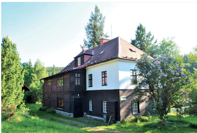
Obr. 4: Budova čp. 29, v níž sídlila hubertovská lesní správa Řádu německých rytířů.