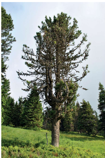
Obr. 6: Jeden z cca dvaceti přeživších kusů borovice limby, jež se na bruntálské straně hor vysazovala právě za Wehrbergera.