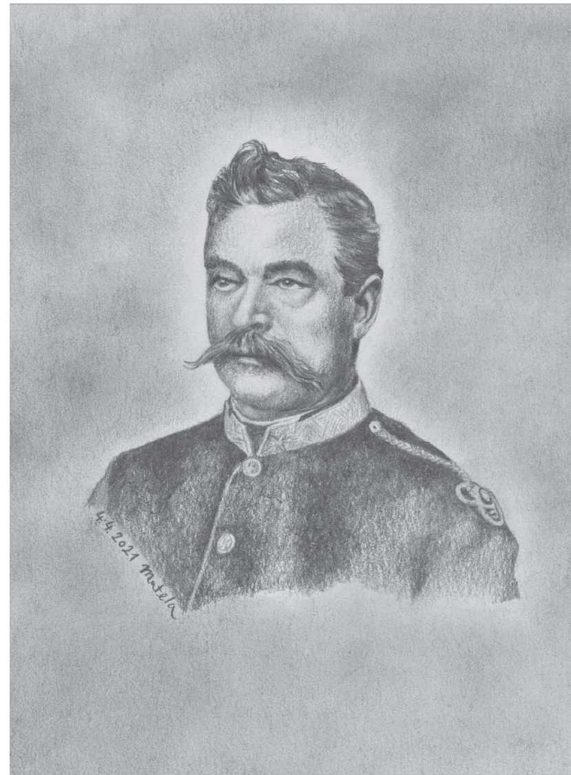
Obr. 2: Kresba Adolfa Wehrbergera zhotovená podle jediné dochované fotografie. Nakreslil autor článku.