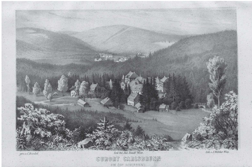
Obr. 1: Litografie Karlovy Studánky s osadou Hubertov (v pozadí) z 60. let 19. století. Vědecká knihovna v Olomouci, sign. 997.636.