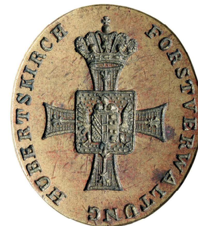
Obr. 5: Kovové razítko lesní správy Hubertov, 19. století.

ZAO, fond Velkostatek Bruntál, inv. č. 1299.