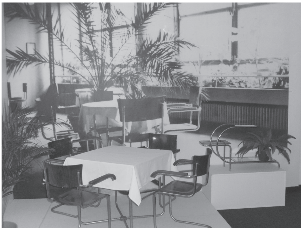
Jídelní set, židle s područkami bez zadních noh, nábytek z ocelových chromovaných trubek, výrobce neuveden, 30. léta 20. století, soukromé a stolek na květiny, chromovaná trubková ocel, výrobce fa Hynek Gottwald, Brandýs nad Orlicí, od 30. let 20. století, soukromé. V pozadí fotometráž z interiéru Plicního sanatoria v Jablunkově z roku 1935, Muzeum Těšínska.

dva katalogy stavebního průmyslu pro Československo, jež vyšly v letech 1931 a 1933. 4 Záměrem vydatelů bylo sloučit do jednoho svazku firmy a jejich produkci a vytvořit tak přehled o novinkách z oblasti stavebních výrobků a hmot. Měly být především pomůckou architektům a stavitelům. V té době to byl u nás ojedinělý projekt, který se nechal inspirovat katalogy tohoto druhu vydávanými ve Spojených státech, Francii, Švýcarsku, Německu a Rakousku.