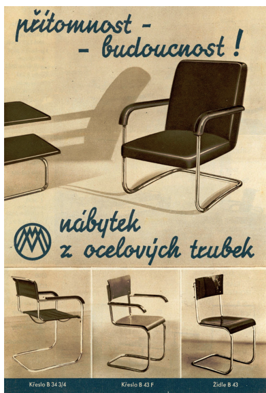
Titulní strana propagační skládačky firmy Mücke-Melder, 30. léta 20. století, Muzeum Těšínska.

a Hynek Gottwald z Brandýsa nad Orlicí. Na výstavě byly zastoupeny prodejní katalogy firem a některé z výrobků. Šlo především o ukázky z prodejních katalogů firmy O. Slezák Bystřice pod Hostýnem a sérii propagačního materiálu vítkovické firmy Mücke-Melder, která působila ve Fryštátě (dnešní Karviná). 2 Produkce firmy byla opravdu bohatá. Sortiment zahrnoval kovový nábytek a úplná zařízení pro nemocnice, sanatoria, léčebné ústavy a praktické lékaře, moderní kovový a ocelový nábytek (chromovaný či lakovaný), dále patentní hygienická okna ACIOK, speciální okenní konstrukce pro operační sály, lisované ocelové dveře a zárubně a drátěná oplocení všeho druhu. Nábytek z ocelových trubek značky Mücke-Melder byl vyvážen do celého světa a těšil se značné oblibě. Z nábytkových kusů trubkové konstrukce byl vystaven především sedací nábytek – klasická židle bez zadních noh, psací stůl, gauč, čalouněná křesla, jídelní set, stůl na květiny, přízední věšák a pelesti postele. 3