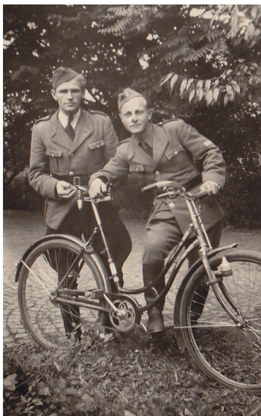
Obr. 1: Příslušníci SNB v pohraničí krátce po skončení války. SZM, podsběrka Novodobé dějiny, inv. č. IV B 810.

a SA, popíral rovněž svou angažovanost ve Werwolfu. Příslušnost k Werwolfu začala být předmětem zájmu SNB a lidového soudu až začátkem podzimu 1945, tedy v době, kdy došlo k posledním zatčením příslušníků buňky v Malé Morávce. 37 Daný postup vyšetřování si lze vysvětlit především tím, že během května a června nevedl SNB dosud ve větším povědomí organizaci Werwolf. Pozornost SNB se uvedeným směrem zaměřila až poté, co z čs. pohraničí začaly přicházet zprávy o činnosti zmíněného uskupení. Ostatně teprve během srpna a září vydalo Ministerstvo vnitra instrukce rozdělující přesně kompetence ve věci vyšetřování Werwolfu a návod, jak postupovat. A dokonce až v průběhu října vyšlo nařízení, jakým způsobem mají jednotlivé služebny a velitelství SNB podávat centrále zprávy o Werwolfu a čemu mají vyšetřovatelé při výslechu zadržených věnovat pozornost apod. 38