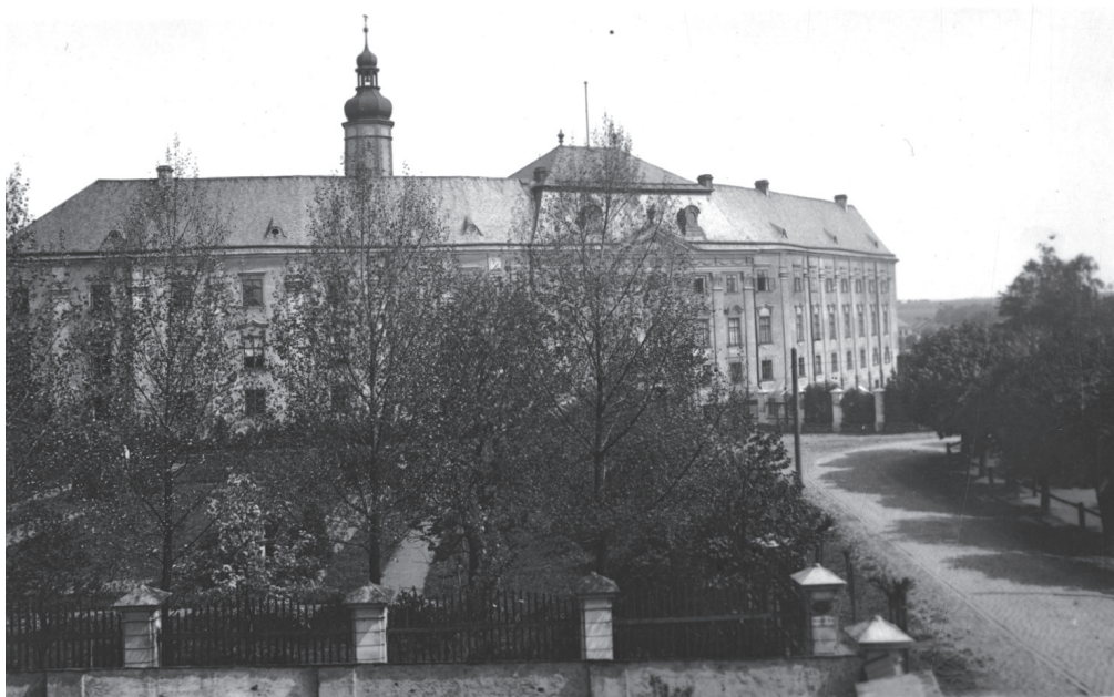
Obr. 3: Bruntál, pohled na zámek, počátek 20. století ev. č. 82.2709.

zařízení, 58 oproti němuž spis Wilhelma Albrechta Tiemanna (1774–1841) orientoval čtenáře k problematice surovinové základny moderního železářství. 59 Poslední záznam sekce hornictví se týká jistě publikace o mineralogii, za jejíhož autora lze považovat německého přírodovědce Johanna Ludwiga Jordana (1771–1853).