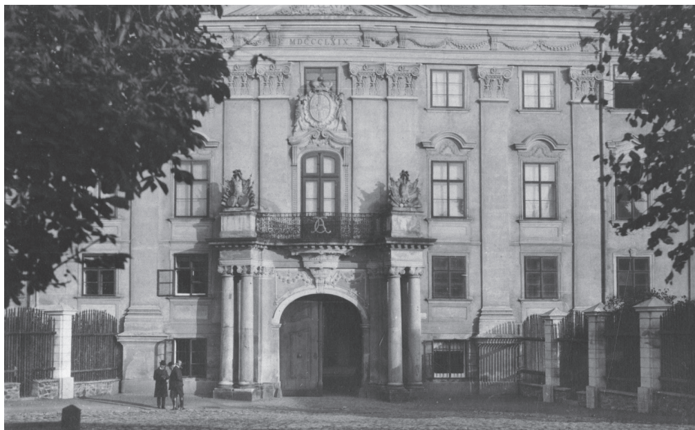
Obr. 2: Bruntál, vstup do zámku, počátek 20. století SZM, ev. č. 82.2710.

Kunitschova (1765–1835) Homonyma 23 a slovník Josepha Richtera (1748/1749–1813) 24 příručkami jazykovědnými, k nimž náleží rovněž gramatika češtiny Karla Ignáce Tháma (1763–1816), 25 jistá latinská gramatika, jinak blíže neurčitelná, a Kirschova (?–1716) Cornicopia . 26 Historický lexikon Thomase Broughtona (1704–1774) je prací povytce historickou 27 a anonymní slovník antické literatury je literárně historickou učebnicí. 28 Zastavit se musíme u záznamu Walchs historisches Lexikon o dvou svazcích: snad jde o známý dvojdílný filozofický (sic!) lexikon luteránského pastora Johanna Georga Walcha (1693–1775).